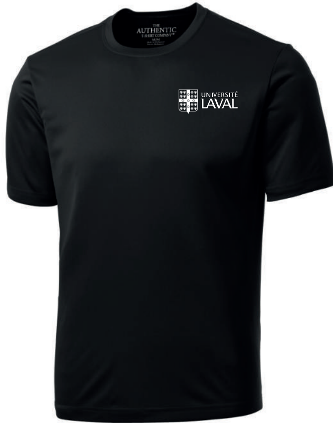
Impression - 1 couleur