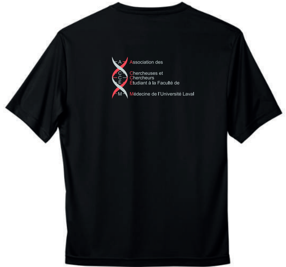
Impression - 2 couleurs