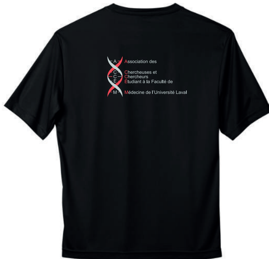
Impression - 2 couleurs