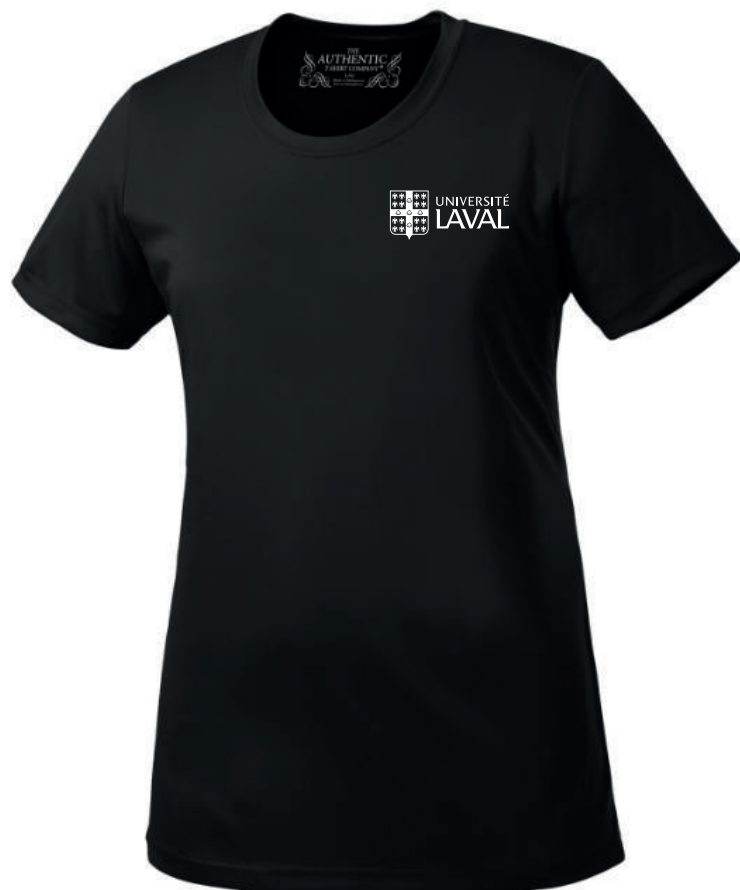
Impression - 1 couleur